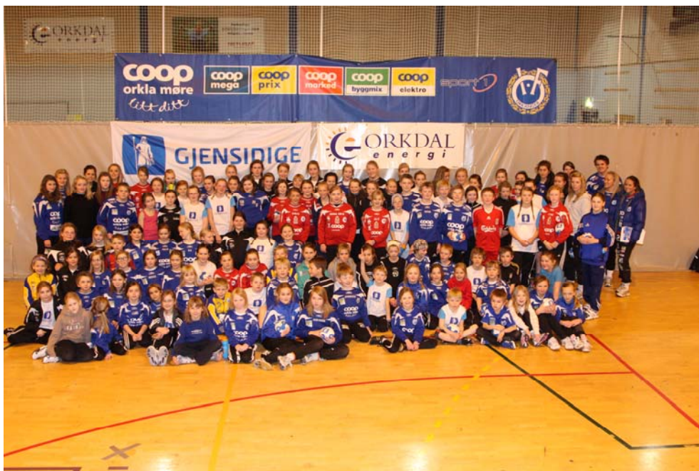
Deltakere Gjensidige Håndballskole 2010