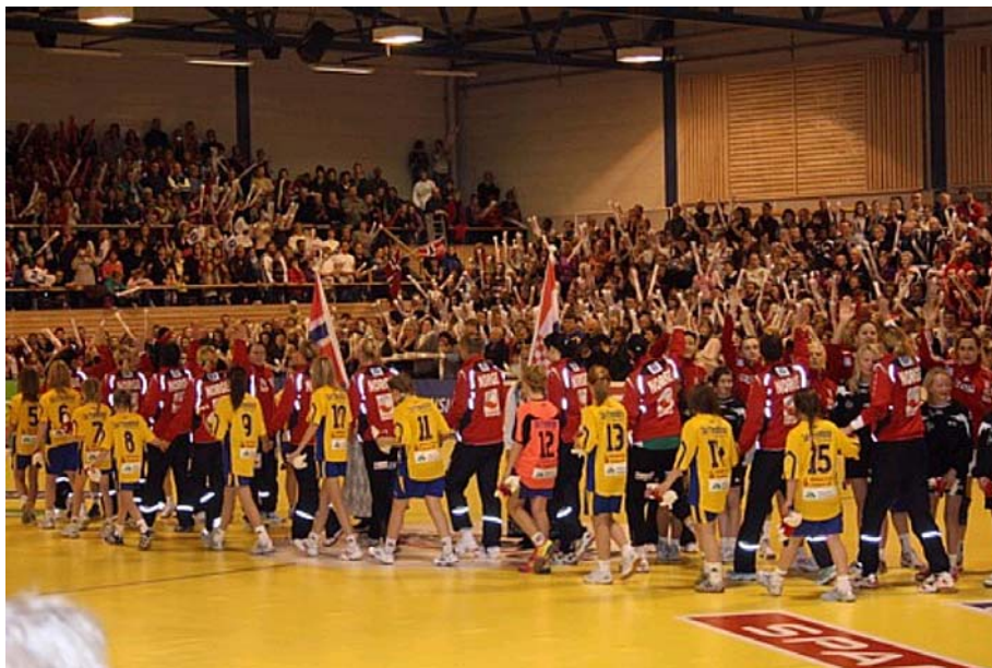
Møbelringen Cup 2009

Dugnadsinnsats er nøkkelordet for håndballsporten i Orkanger Idrettsforening fra den spede begynnelse og fram til i dag. Det er lagt ned betydelig innsats fra mange mennesker gjennom flere år som gjør at håndballsporten i Orkanger Idrettsforening har overlevd i både opp- og nedgangstider.