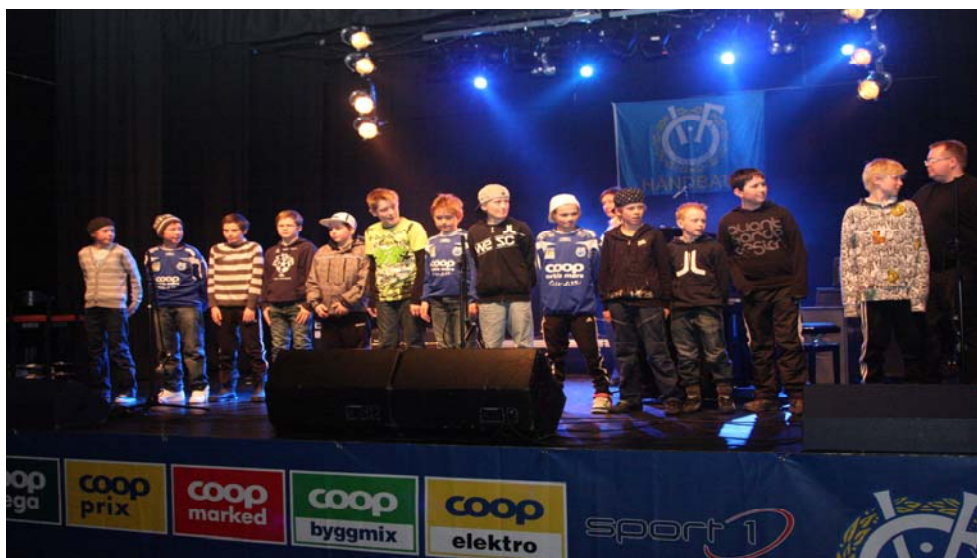
OIF G11 – Seriemester og kåret til årets lag 2009/10