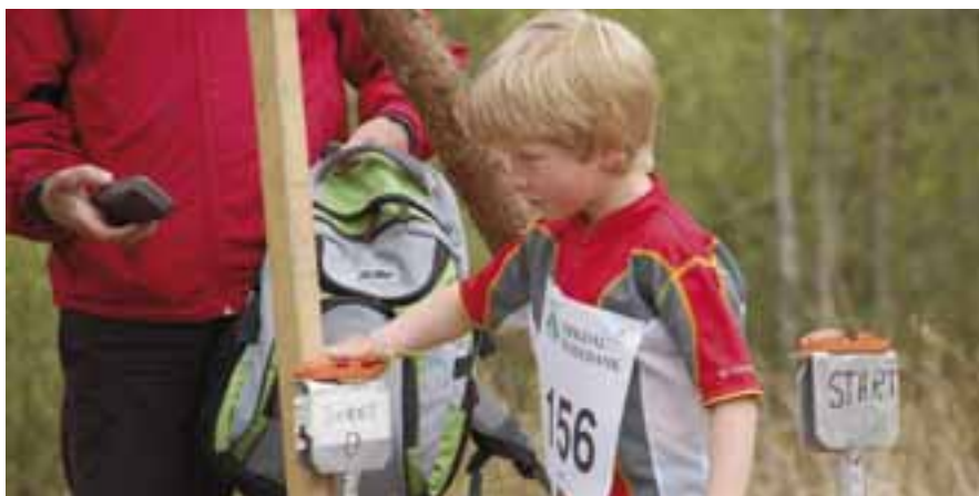
Rekruiteringsarbeidet til o-sporten er igang!