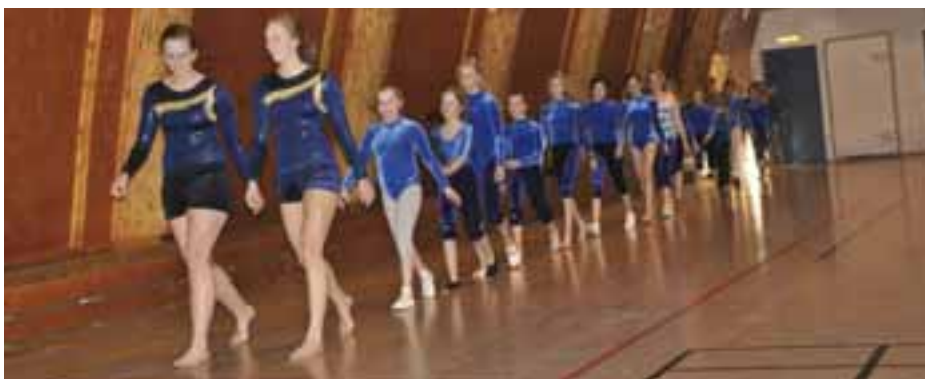
Glimt fra Klubbmesterskapet 2010