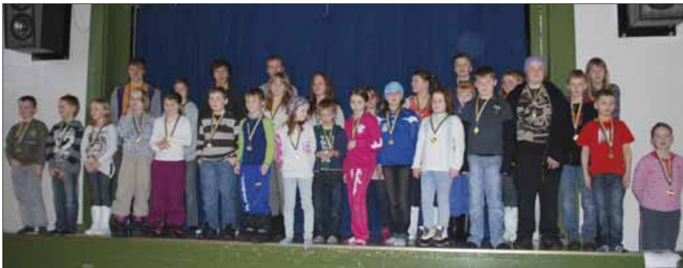
OIF-svømmere hedres under ei samling på Orkanger barneskole.

Svømmeavdelinga i OIF er ei avdeling med mye liv og aktivitet, og har fylt opp den tiden vi har til å være i vann.