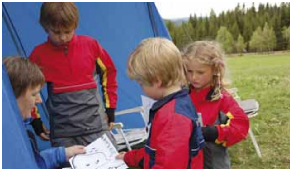
Unge o-løpere får kurs i kartlesing.

Dessuten er det planer om treningsløp for Petter Thoresen og det norske o-landslaget i forkant av VM i Trondheim,