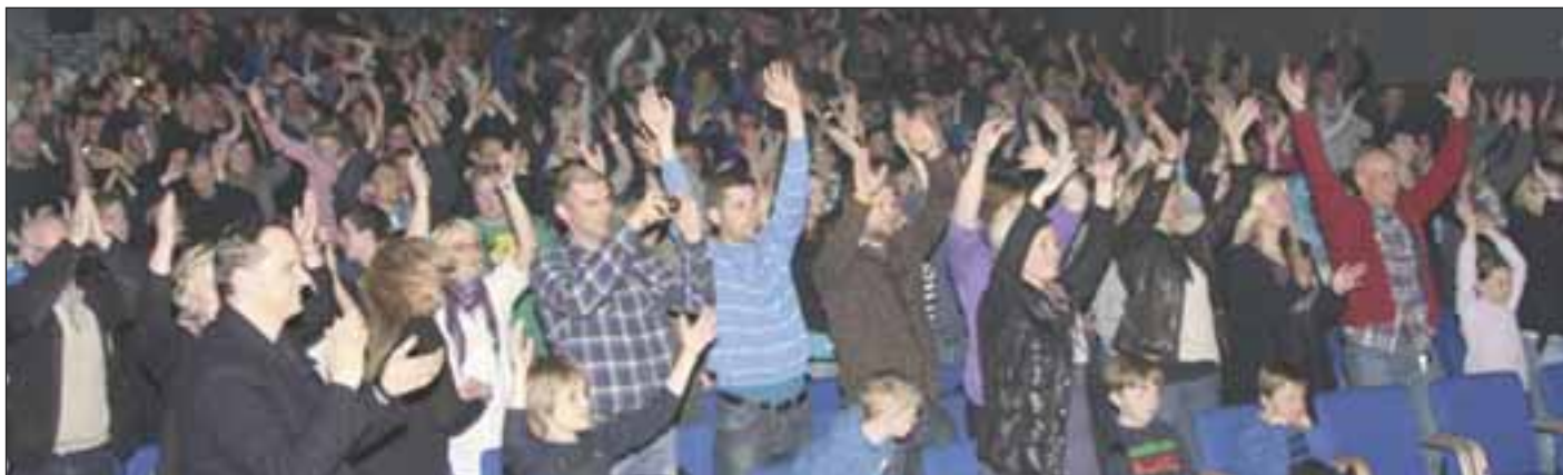
Glimt fra sesongavslutninga: Stor stemning i smekkefull kinosal

OIF Håndball markerte sesongavslutning torsdag 18. mars. Dette ble gjennomført med et flott og stilfullt arrangement i Orkdal Rådhus. Over 300 (!) spillere, trenere, lagledere, dommere, foresatte, sponsorer og andre inviterte gjester koste seg med god underholdning og flotte presentasjoner av OIF Håndball gjennom siste sesong.