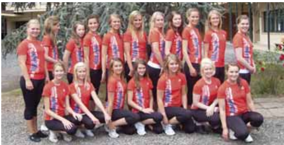
Troppen som drar til Eurogym i Danmark

I juli reiser ni jenter og to gutter fra OIF til Eurogym i Odense i Danmark. De har trent siden i fjor til denne begivenheten og