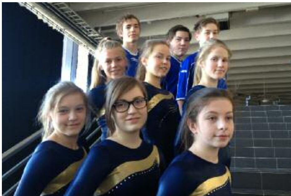
OIFs turnere som deltok i konkurransen Opplandspokalen 2013.

turnerne er barnekretsturnstevnet, som i år skal foregå i Leangenhallen i Trondheim. Orkanger stiller som vanlig med en av de største troppene.