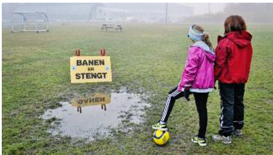
Målet er å fjerne dette skiltet fra ballsletta i Idrettsparken en gang for alle.

OIFs årsmøte vedtok at bygging skjer først når prosjektet er å betrakte som fullfinansiert – det vil si at det krever reelt lite lån. Økonomien skal være bæ-