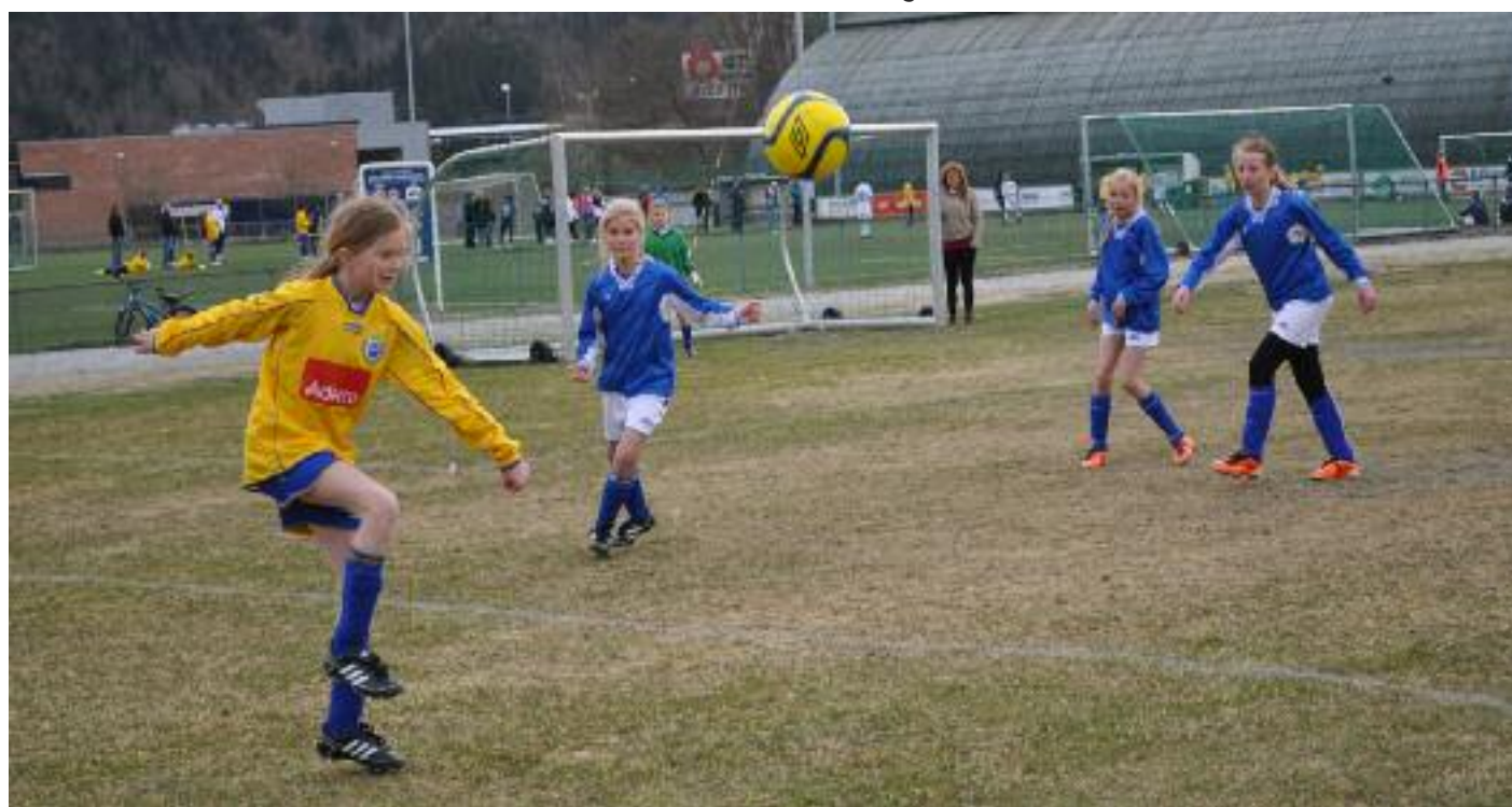
Dette jordet skal bli helårs kunstgressbane. OIF-fotballen har eksplodert, særlig blant jentene, men mesteparten av året kan ikke klubben tilby spilleflater. Bildet er tatt våren 2012.

På orkanger-if.no finner du komplett oversikt over bedrifter, lag og personer som støtter arbeidet med kunstgressbane på ballsletta.