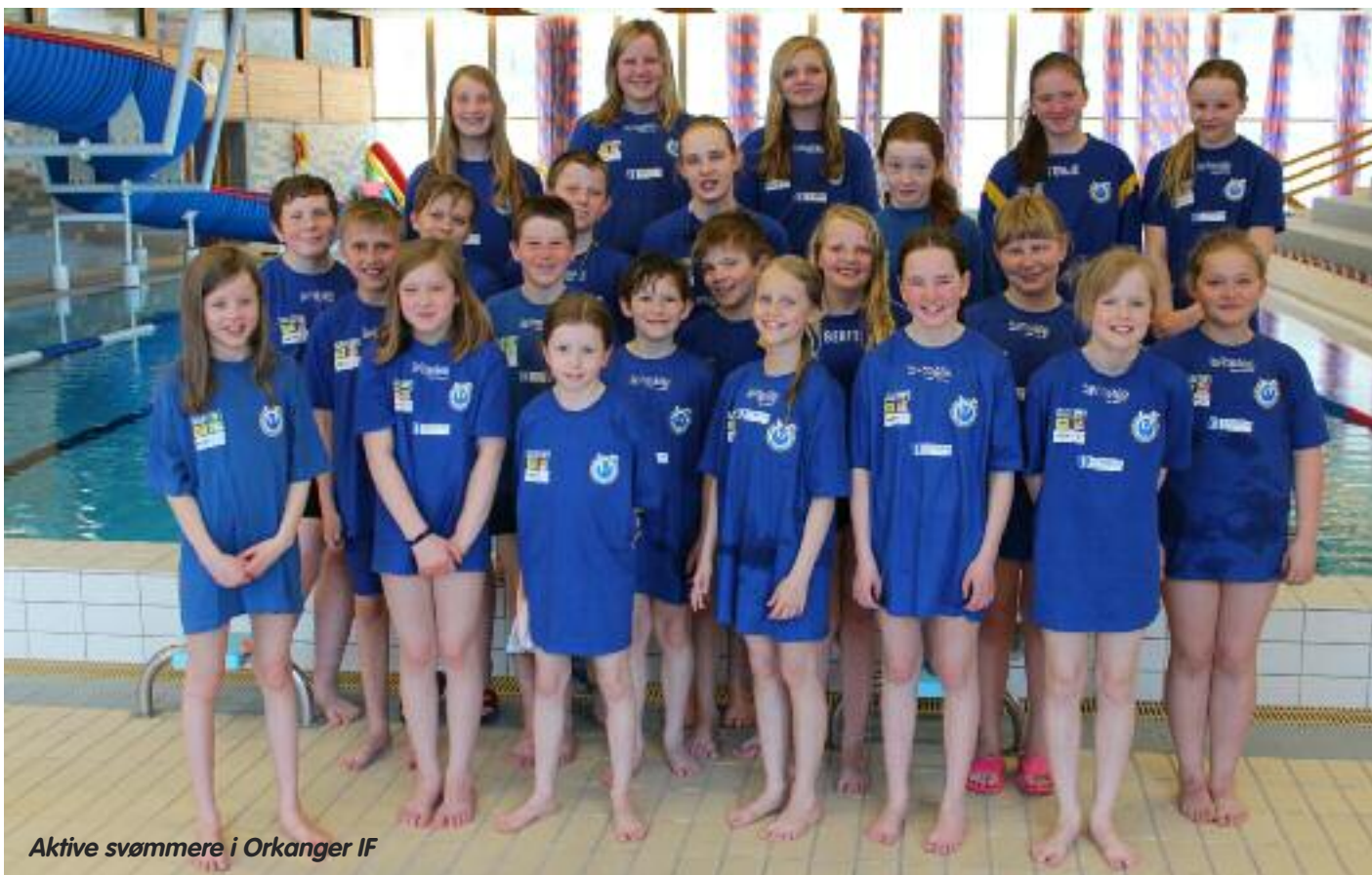
Aktive svømmere i Orkanger IF

Svømmeavdelinga har hatt god sportslig utvikling på flere plan. Og vi har fortsatt tilbud om baby- og småbarnsvømming hver lørdag mellom kl .09.30 og 11.30 i sjukehusbassenget.